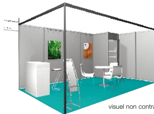
visuel non contractuel