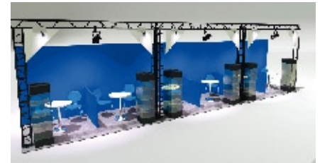
visuel non contractuel