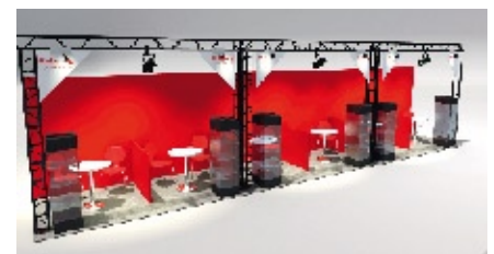
visuel non contractuel